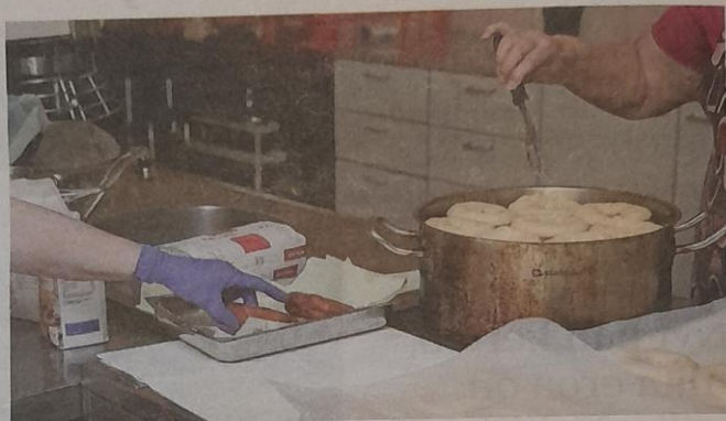
Vapaaehtoistehävissä henkilö voi hyödyntää omaa elämäkokemustaan ja osaamistaan, kehittää itseään ja vaikuttaa tärkeäksi kokemuksiinsa asioihin.

Vapaaehtoistehävissä henkilö voi hyödyntää omaa elämäkokemustaan ja osaamistaan, kehittää itseään ja vaikuttaa tärkeäksi kokemuksiinsa asioihin. Vapaaeh-