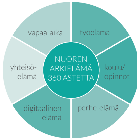
Kuva 1. Nuoren elinympäristöt 360-mallin mukaisesti. (Hvem är de unge på kanten av det danske samfunnet /Erik Häggman)

Aivan kuten Tanskan tutkimuksessa, maahanmuuttajataustaisten nuorten elämää on hankkeessa seurattu vapaa-aikaan, kouluun, työelämään, perheeseen, digitaaliseen elämään ja yhteisöihin liittyvien asioiden kautta. Näistä elämän eri osa-alueista nuorilla on ollut myös paljon kerrottavaa.